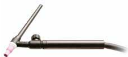
G 140 RA