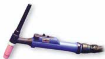
G 221 UD/D