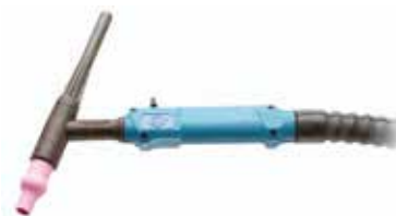
G 220 UD/D