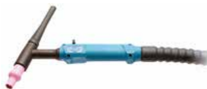
W 400 UD/D